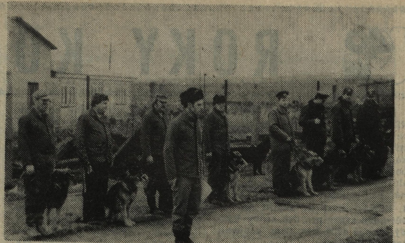
SOUTĚŽ VE VÝKONU SLUŽEBNÍCH PSŮ uspořádali na počest 37. výročí Vítězného února pracovníci zvláštního odboru. Boj o vítězství byl velmi vyrovnaný a psoucí i jejich čtyřnozí pomocníci dokázali, že jsou na plnění svých úkolů opravdu dobře připraveni.

Pro účastníky všech věkových kategorií budou připraveny trasy od 10 do 60 km. Pěší trasy 10, 15, 25, 35 a 50 km a také novinka — cyklotrasa 60 km. Start všech tras bude od 6 do 9 hodin na ústředním stadionu v Mladé Boleslavi. Čl. bude opět na ústředním stadionu. Výjimkou bude jen trasa 10 km, která bude končit na Zvířetích a účastníci se vrátí zpět do Mladé Boleslavi vlakem z Bakova n. Jiz. nebo autobusem MHD z Josefova