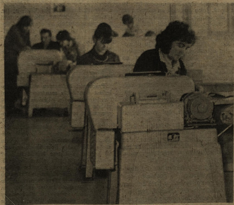
Zemědělská strojní početní stanice zahájila v těchto dnech provoz. Na strojích ARITMA za pomoci děrných štítků vypočítávají mladé pracovnice zatím jen mzdy zaměstnanců čtyř státních statků.

A pak bude všechno v pořádku? Na výměnkových stanicích v jednotlivých obvodech mohl být nepřiznivý stav v dodávkách tepla ještě zhoršen nevhodnou regulací či zanešením výměníků apod. Nemusíme snad zdůrazňovat, že snažou všech je postarat se obyvatelům Mladé Boleslavi o příjemnou tepelnou pohodu. V budoucnu, i když poruchy vyloučíme, rozhodně obětavou prací všech zúčastněných zmírníme jejich následek na nejmenší míru.